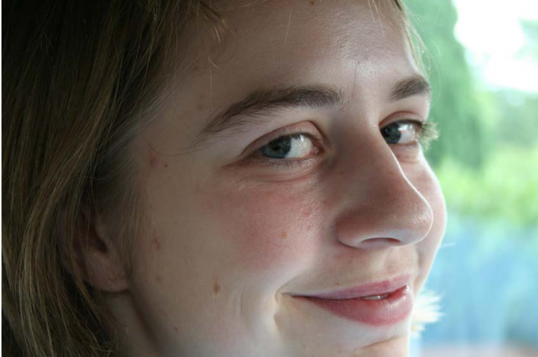
Un sourire pincé avec dents presque cachées

sympathie ou de l'amitié. Les dents sont presque cachées et prennent une forme allongée. C'est en général le sourire que de nombreuses personnes présentent quand elles font semblant d'apprécier une blague nulle.